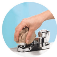
6-Fermer avec le papier