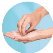
3-Nettoyer les ongles